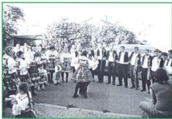
ZAKŘANSKÉ HODY 2006