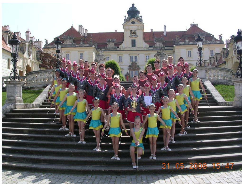
ZAKŘANSKÉ MAŽORETKY 2008