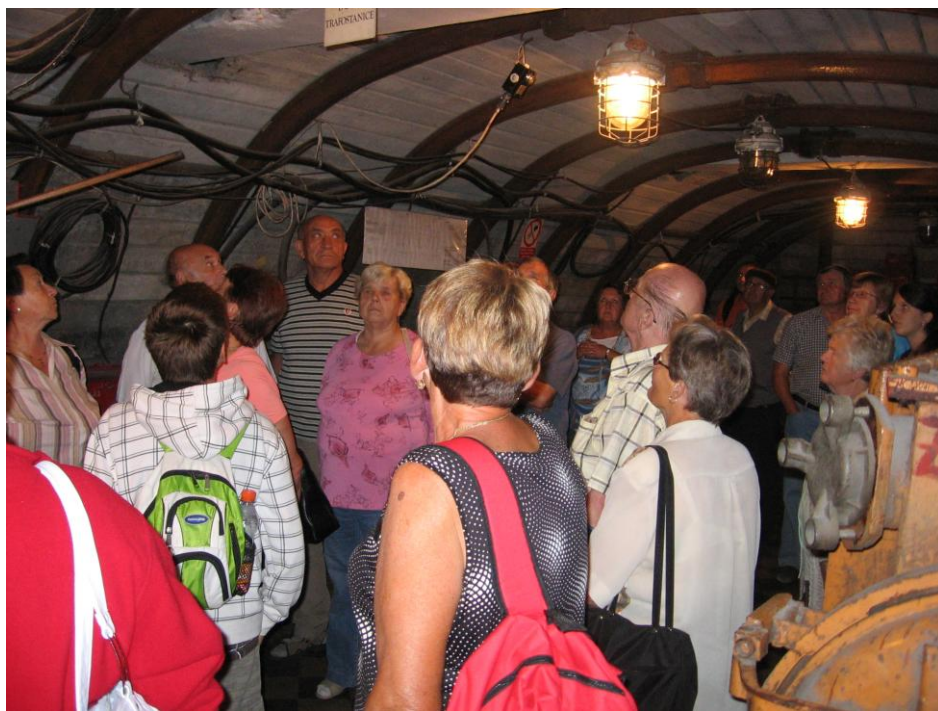
ZAHRÁDKÁŘI V UHELNÉM DOLE „ANSELM“