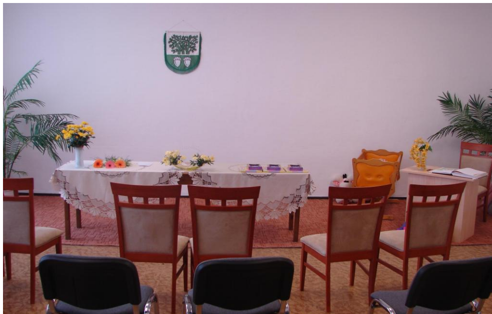
Nová obřadní síň v budově č. 92

Kanál 26 NOVA, NOVA CINEMA, PRIMA, PRIMA COOL a BARRANDOV