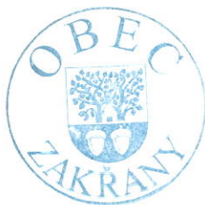
Obec Zakřany (poskytovatel)